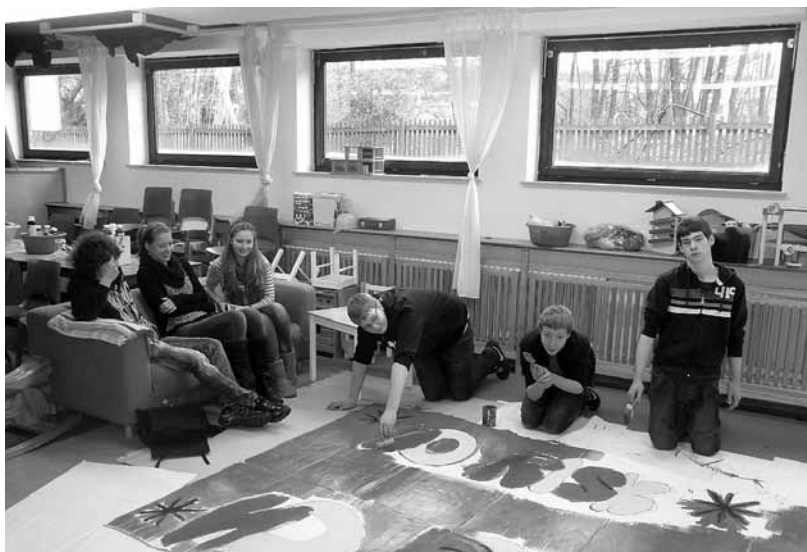
Konfirmanden arbeiten an einem großen Plakat mit dem Motto der Show.

Wir freuen uns auf viele junge und ältere Besucher. D. Harth